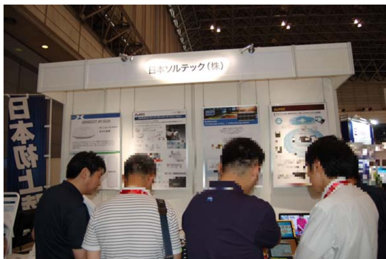
日本ソルテック ブース